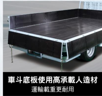
車斗底板使用高承載人造材 運輸載重更耐用