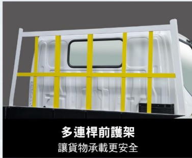
多連桿前護架 讓貨物承載更安全