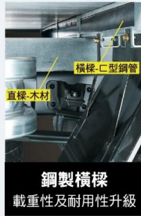
鋼製橫樑 載重性及耐用性升級