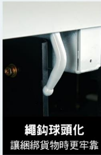
繩鈎球頭化 讓網綁貨物時更牢靠